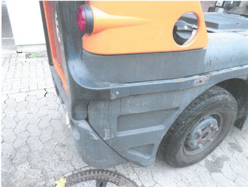
Bild 13 : Diverse Verschrammungen / Verformungen am Aufbau / Chassis