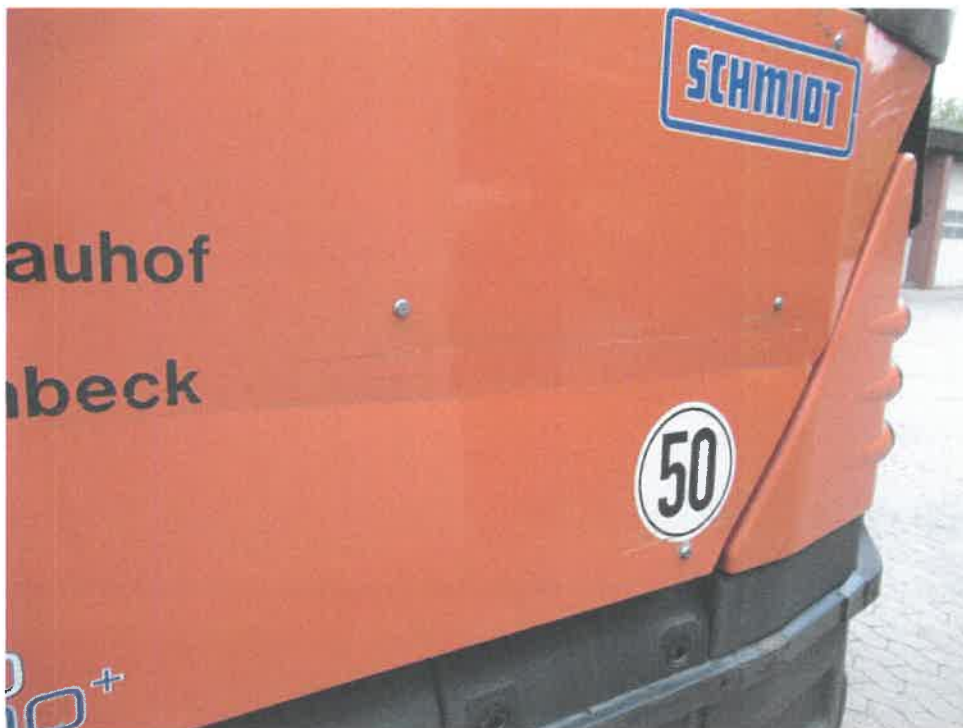
Bild 12 : Diverse Verschrammungen / Verformungen am Aufbau / Chassis

0000 p038/ EPPN/C0118638790_30_1_C8 // 161891 * 76 1505 14/17