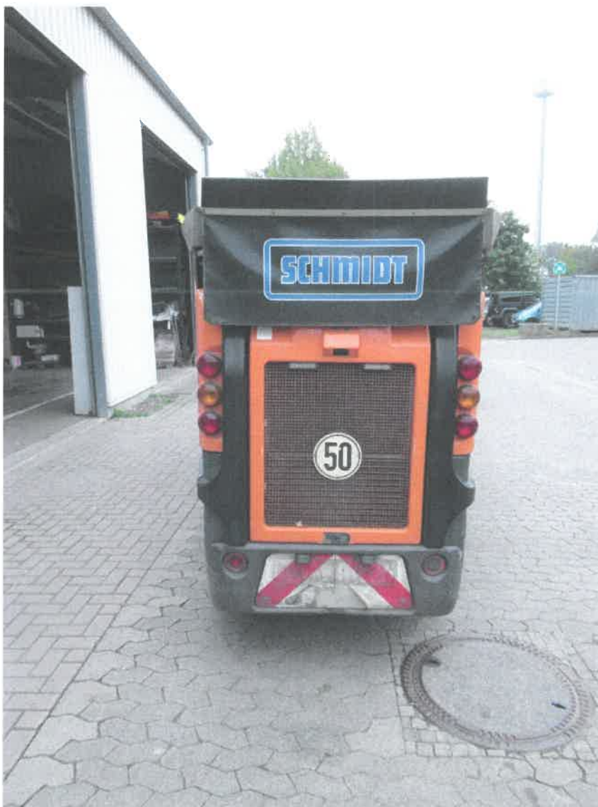
Bild 10 : Diverse Verschrammungen / Verformungen am Aufbau / Chassis

0000 po38 / EPPN/C0118638790_30_1_C8 // 151891 * 76 1564 13/17