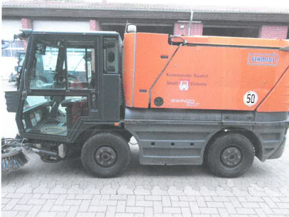
Bild 11 : Diverse Verschrammungen / Verformungen am Aufbau / Chassis