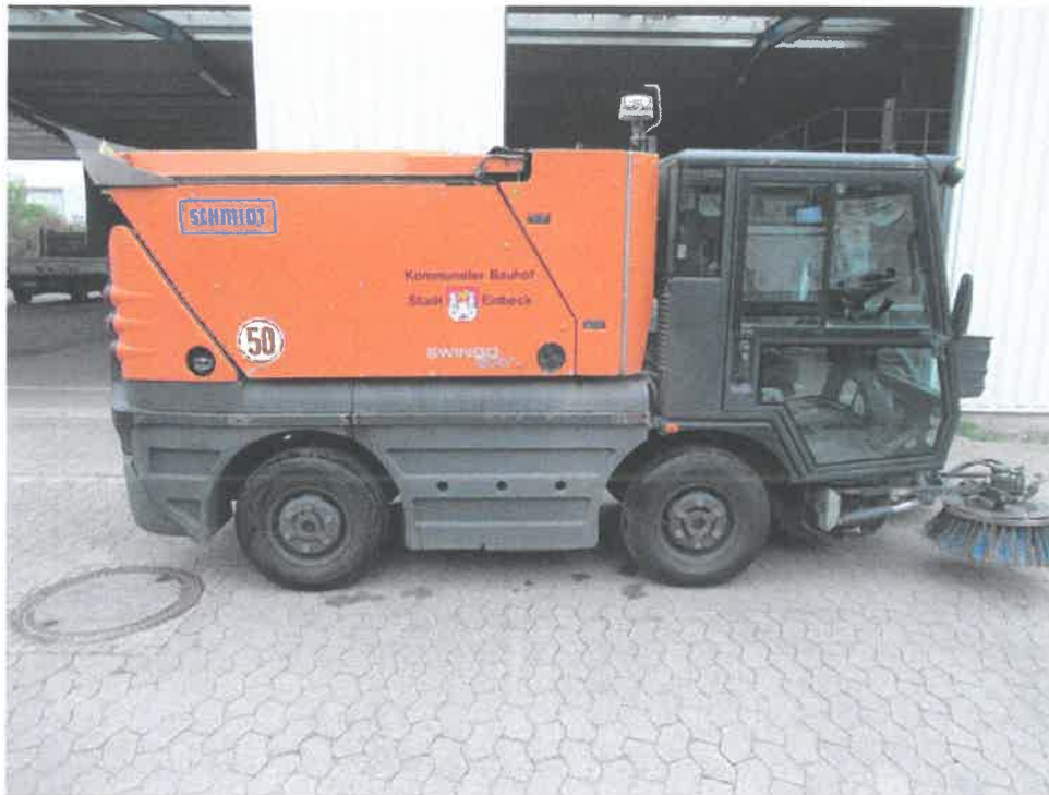
Bild 9 : Diverse Verschrammungen / Verformungen am Aufbau / Chassis

0000_p038/EPPN/IC0118638790_30_1_C8 // 161891 * 76 1563 12/17