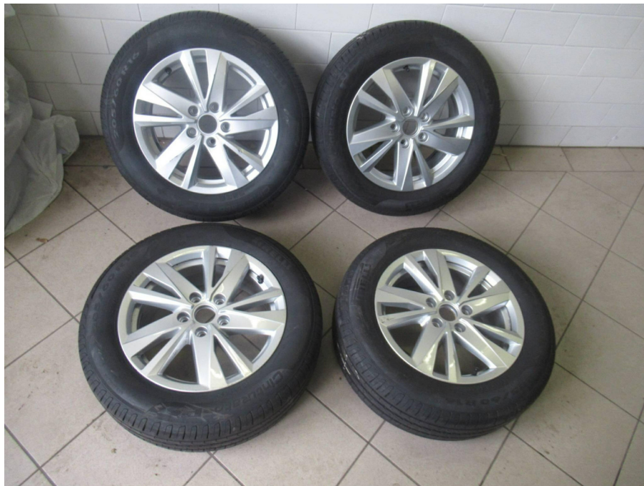
Zusätzlicher Radsatz Sommer