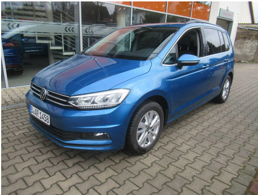
Übersichtsbild vorne links