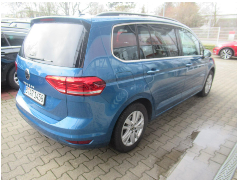
Übersichtsbild hinten rechts